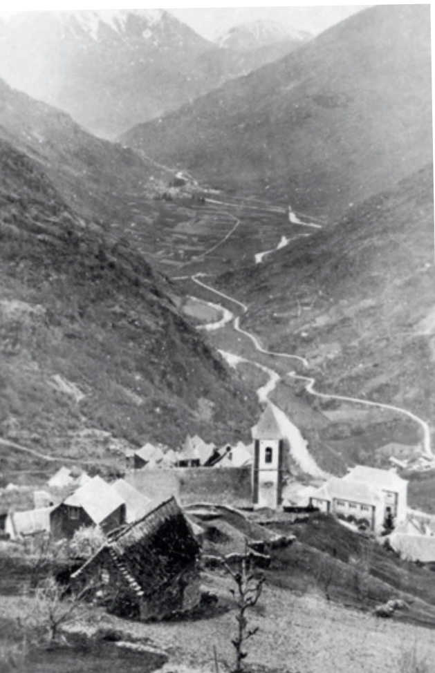
Era Val d'Aran des de Canejan ena prumèra part deth sègle XX // PROCEDÈNCIA: Col·lecció Claudio Aventín-Boya.

Totau mès de 800 abitants, encara que beth còp se suspassèc eth millenat, segons d'autes dades demografiques oficiaus, en aguest moment entre sègles. Tot açò coincidís damb era grana espleita minera d'enterpreses franceses, belgues e espanhòles, qu'arribèren a bastir lauadèrs o bocards, honeria, eth prumèr teleferic en 1910-1911 de mès