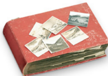
Àlbum de fotos. AUTOR: Felipe Valladares