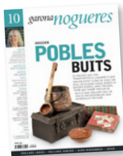
FOTO DE PORTADA REALITZADA AMB OBJECTES CEDITS PER L'ECOMUSEU DE LES VALLS D'ÀNEU.

Adreueu-vos a CEDRO (Centre Espanyol de Drets Reprògràfics) si necessiteu reproduir algun fragment d'aquesta obra, o si desitgeu utilitzar-la per elaborar resums de premsa (www.cedro.org; 91 702 19 70 / 93 272 04 47).