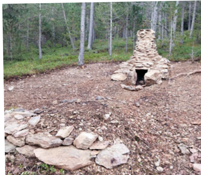
Reconstrucció hipotètica del forn de la Trenca, segles V-VI, a partir de dades arqueològiques, dins de l'itinerari Costa dels Meners // FOTO: Óscar Augé.

Espai visitable. Ara mateix el Pallars Sobirà té les evidències més antigues a Catalunya de la primera part de la cadena operativa de la producció del ferro. El Parc Natural de l'Alt Pirineu, l'Ajuntament d'Alins, l'Ecomuseu de les Valls d'Àneu i la UAB han habilitat un itinerari que ens permet recórrer en família aquesta època de boscos i muntanyes de ferro: l'itinerari de la Costa dels Meners 🗺️.