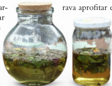
Una garrafa i un pot amb les herbes preparades per deixar a sol i serena.

El dia del taller, els assistents venien amb les seves garrafes i compra-