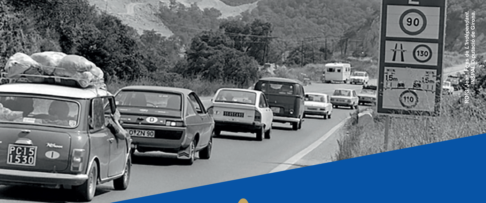
ROIG, Jean. Forns de L'Independant. INSPAI. Diputació de Girona.