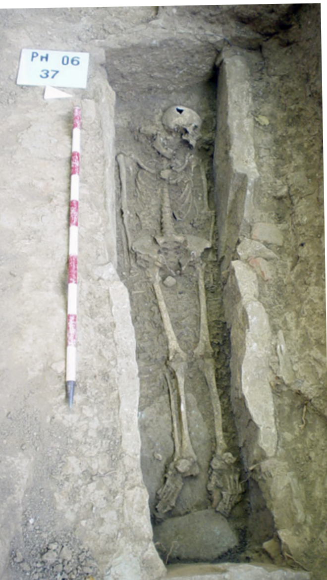
Un dels enterraments visigòtics en cista apareguts al Pla de l'Horta (enterrament 37).

El més destacable d'aquest cementiri és que es tracta de l'única gran necròpolis visigoda del segle VI que es