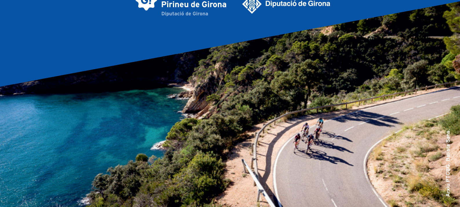
Arxiu PTCBG. Batista Sans.