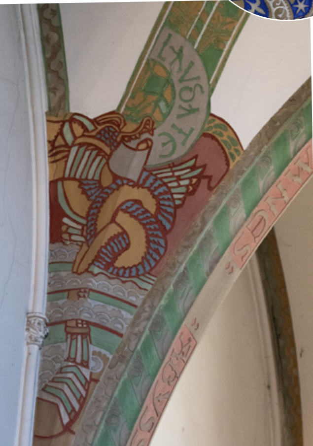
Esgrafiat amb la figura del drac, que evoca els monstres de l'abisme. Al detall, clau de volta decorada amb estels, flors de lis i esquel·lerincs.