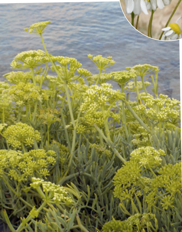
A l'esquerra, fonoll marí ( Crithmum maritimum ). Al detall, capitols de camamilla ( Matricaria chamomilla ).