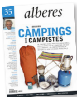
FOTO DE PORTADA REALITZADA AMB MATERIAL CEDIT PER LES FAMÍLIES BECH PADROSA, LLAONA OLIVET, TESTART CARBÓ, CERVIÀ VIDAL I VIÑAS. AUTOR: EDU VIDIELLA.

Adreça a CEDRO (Centre Espanyol de Drets Reprogràfics) si necessita reproduir algun fragment d'aquesta obra, o si desitja utilitzar-la per elaborar resums de premsa (www.cedro.org; 91 702 19 70 / 93 272 04 47).