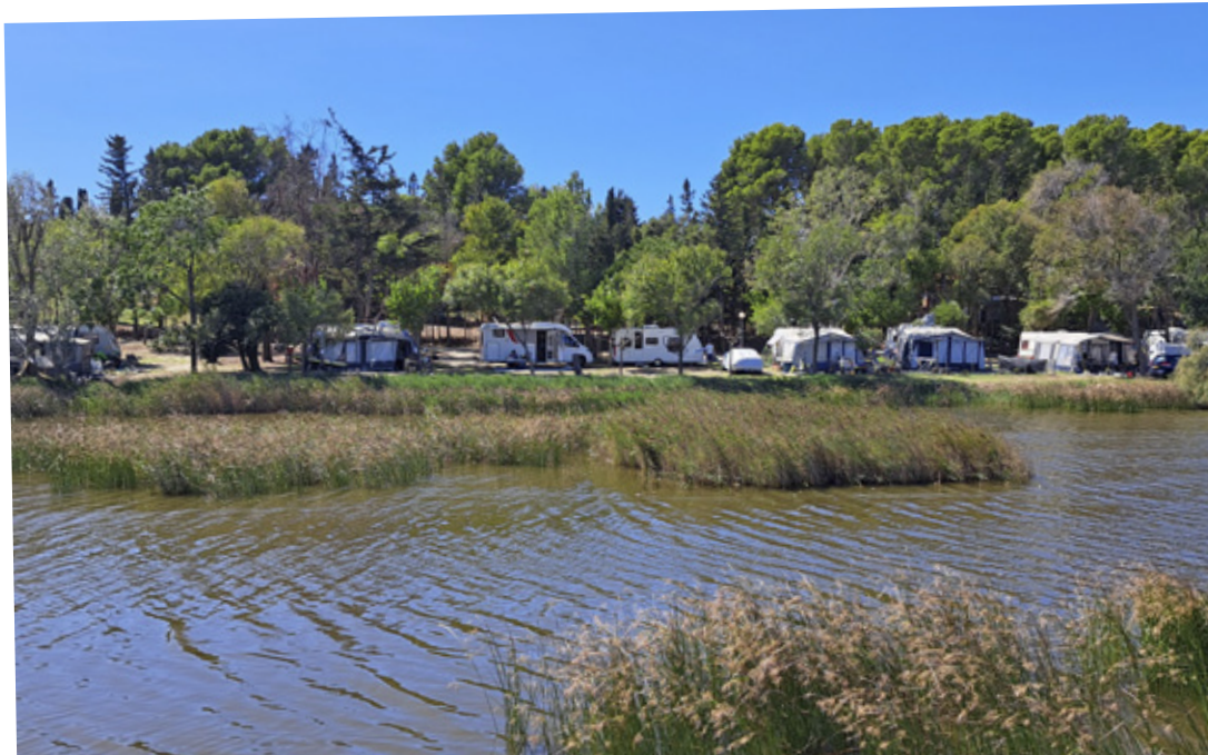
L'estany de Poma a l'actualitat, amb les tendes d'acampada al fons

L'estany de Poma és l'únic estany d'aigua dolça del Montgrí de dimensions considerables. Recull l'aigua dels ullals que afloren procedents dels vessants de ponent del massís que escorri en l'aigua en el fondal, on es va acabar formant un estany que se salinitzava per l'entrada d'aigua de mar en època de fortes llevantades. Estava separat de la platja per un cordó de dunes i formava part d'una extensa zona de maresmes que hi havia en els fondals dels Riells. A banda i banda de la platja també afloren aquests ullals. El nom Riells podria provenir d'aquests rierols. Actualment, els antics còrrecs per on s'escolava l'aigua s'han urbanitzat i transformats en carrers i l'aigua només hi arriba quan plou. A la banda de migdia de l'estany, al peu de la muntanyeta, hi ha un petit bosquet de tamarius i també pins, entre els quals un de considerables dimensions al cim del turó, proper al mas, així com algun roure i oms. També hi ha espècies introduïdes com la morera, el desmai i el pollancre. Hi viuen ànecs collverds, carpes, llisses, anguiles i llobarros que arriben de mar amb les llevantades. Ac-