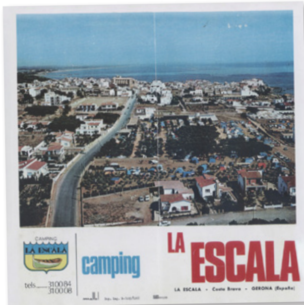
A dalt, entrada al càmping L'Escala, situat al camí Ample de l'Escala. Dècada de 1960. Al detall, publicitat del mateix càmping. PROCEDÈNCIA: Arxiu Frederic Suñé.

Els primers turistes a l'Escala arribaren a la dècada de 1950 i s'allotjaven en els pocs hotels i fondes que hi havia al poble o bé en cases particulars. La majoria eren de procedència anglesa i francesa. Ben