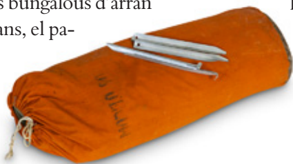
Tenda de campanya.