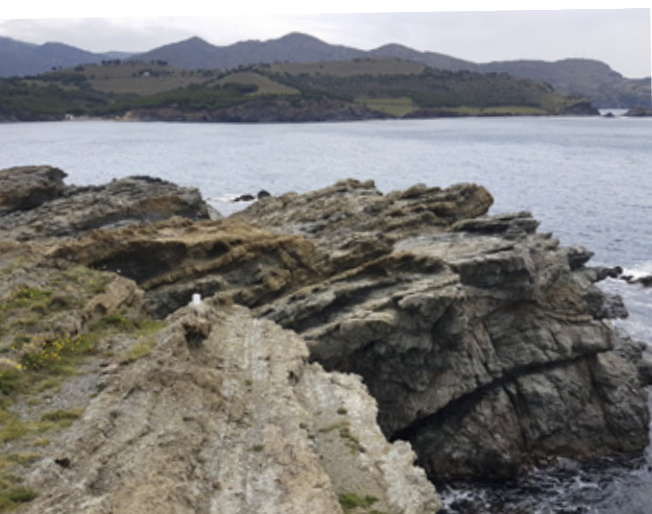
Vista des de cap Ras de la badia de Garbet en primer terme, amb afloraments rocósos modelats per l'erosió marina. Al darrere, la muntanya dels Canons i, tancant l'horitzó, el massís de l'Albera.

A l'Albera, aquestes roques dominen en el sector occidental del massís. El granit és present a la zona de Requesens i Cantallops; la tonalita, entre la Jonquera i el Pertús, i la granodiorita apareix de manera més discreta al sud del terme de la Jonquera. El gneis, derivat del metamorfisme de granitoides